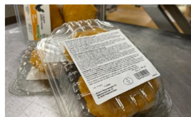
Herkenning van lettertypen en logo's > 1,5 mm.

Standalone of volledig geïntegreerd met de ESPERA weeg- en etiketteersystemen van de NOVA generatie, het nieuwe vision inspectiesysteem biedt maximale kwaliteitscontrole voor uw etiketterproces.